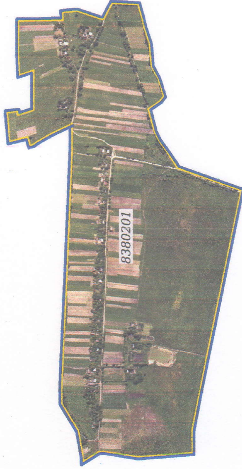
Схема оціночних районів в межах території Радехівської міської ТГ (в межах с. Гута-Скляна)