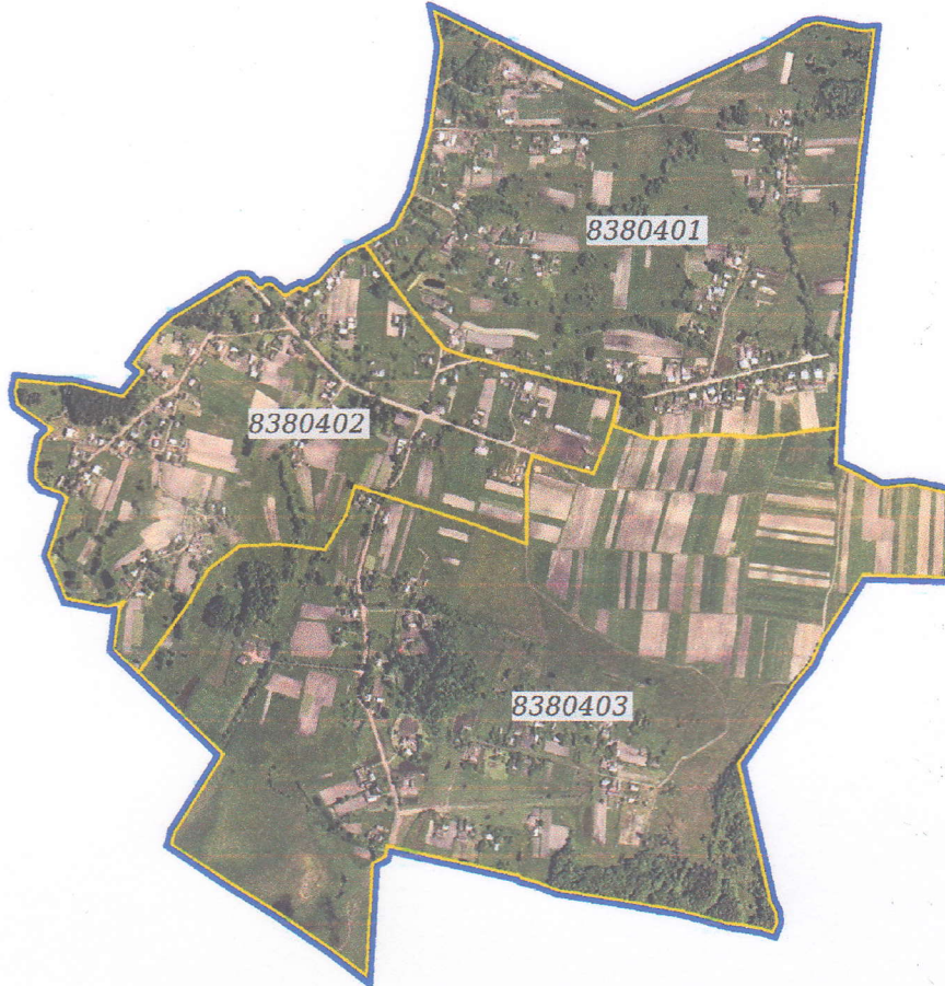
Схема оціночних районів в межах території Радехівської міської ТГ (в межах с. Монастирок-Оглядівський)